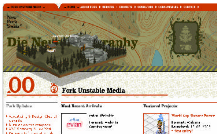
Fig. 2.1: Home page di UnstableMedia.de

E proprio da "Oltre la cortina di ferro" (il titolo della home page) è iniziata l'analisi.