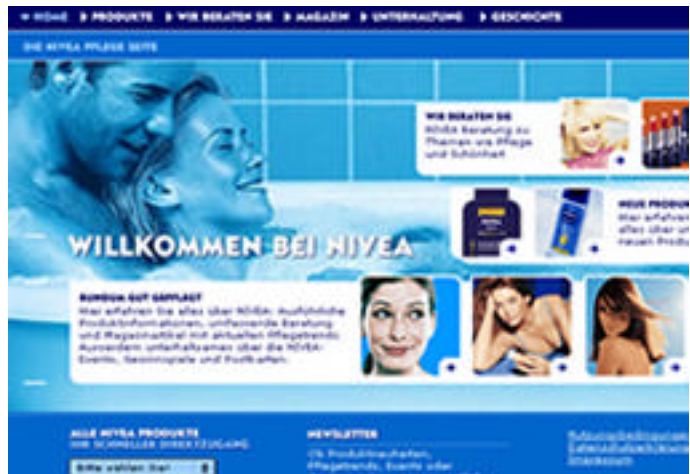
Fig. 5.1.1: Home page di Nivea.de

I valori distintivi della crema, che sono stati conquistati negli anni - fiducia e bellezza - e l'immagine simbolo - la scatola di latta blu - sono alla base dello stile delle pagine del sito. Rispetto alla versione iniziale, con l'ultimo restyling è stata aumentata la presenza di immagini e sono state adottate molteplici tonalità di blu per modernizzare l'aspetto del sito e adattarsi alla varietà di prodotti presentati, pur mantenendo un'apparenza tipica e riconoscibile.