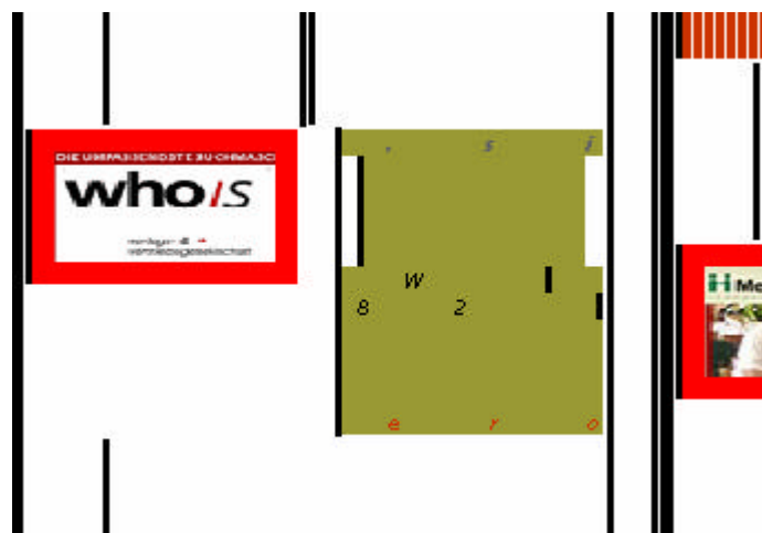
Fig. 4.2: L'esito del 'terremoto' sullo schermo... dopo pochi secondi ed una battuta auto-compiacente, tutto tornerà come prima.

Una bizzarria di più difficile scoperta è quella che nella pagina principale provoca, al passaggio del puntatore sopra una piccola immagine quadrata, un vero terremoto sullo schermo, al termine del quale tutto diventa illeggibile, ma solo per pochi secondi: poi, infatti, si apre una finestra di pop-up con la scritta: "Grado 9 della scala Richter di usabilità".