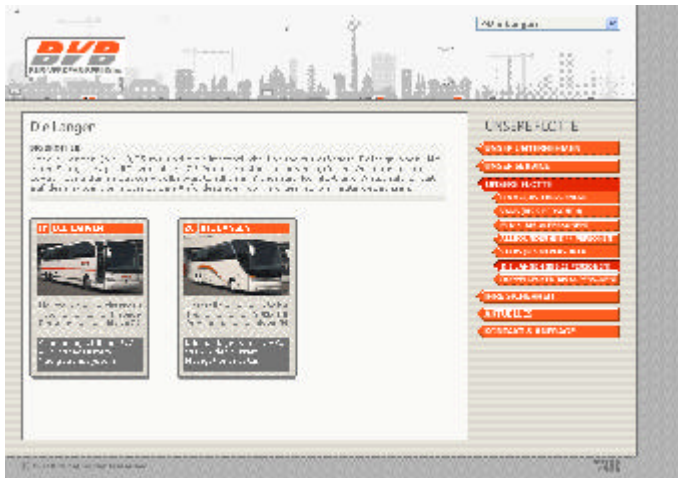
Fig. 5.2.2: Una pagina di informazioni su un tipo di veicoli della flotta della BVB

La consultazione delle pagine, che non occupano tutto lo schermo ma solo una sezione allineata in alto a sinistra, avviene attraverso un menù che ricorda i cartelli stradali e apre le pagine richieste in un frame non ancorato posizionato al centro.