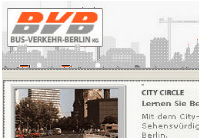
Fig. 5.2.1: Particolare della home page di BVB.de con lo header animato

veicoli della BVB e in cui sono curati anche i minimi dettagli, come per esempio gli ascensori nei palazzi o i bracci delle gru sullo sfondo.