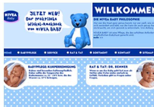
Fig. 5.1.2: L'area di Niveababy.com

Qui la massima intenzione è stata quella di integrare la parte di informazioni con un aspetto più divertente e pagine con consigli e suggerimenti ad hoc.